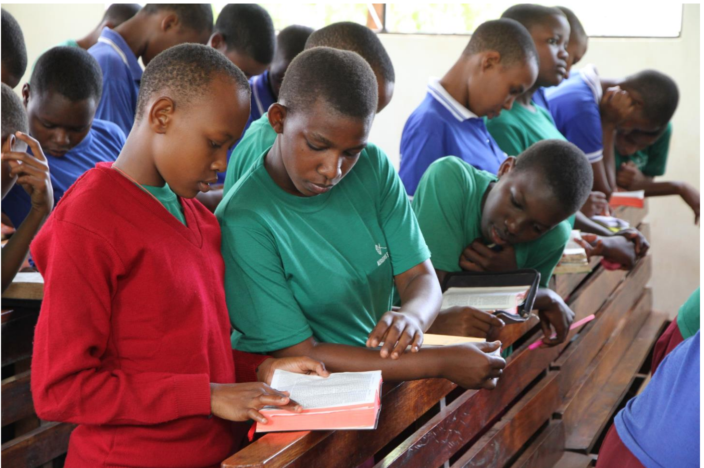
Opiskelijanuoret ovat Mjimweman kirkossa.

Anna tiesi Herran haltuun, turvaa häneen. Hän pitää sinusta huolen, Ps. 37:5.