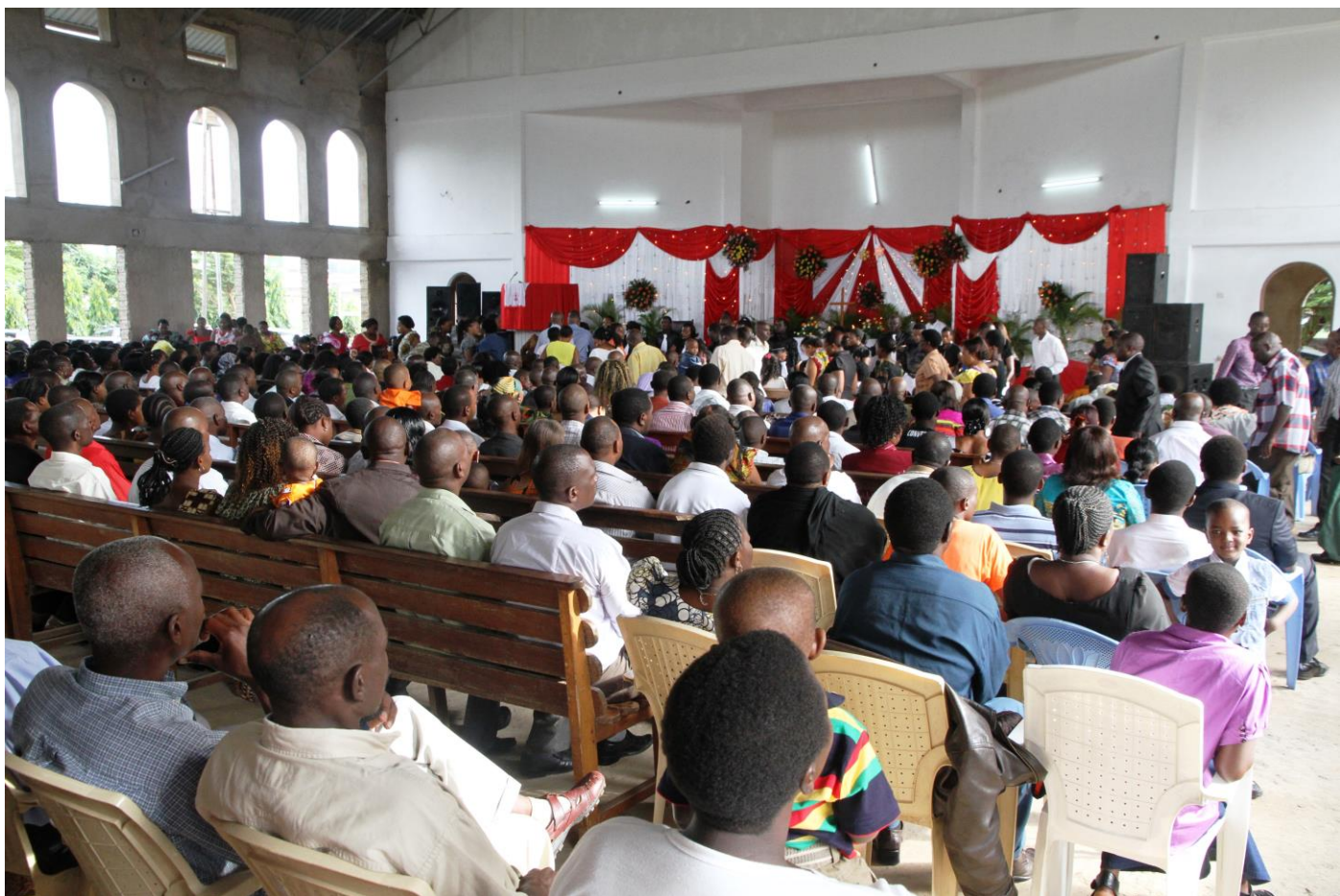
Pääsiäisenä keskustan Mjipyyn kirkko oli täynnä väkeä.