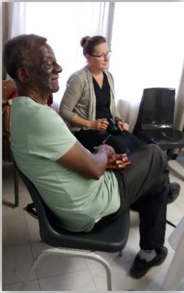
Hiippakunnan Lähetys- ja diakoniapäivät